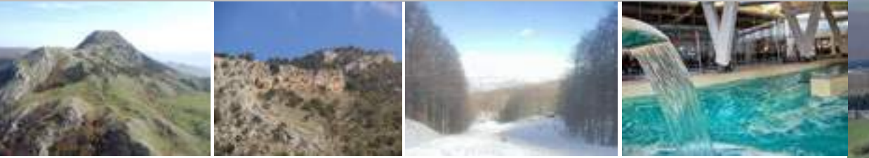
Montagna Grande di Viggiano Località Rupi Rosse Piste da sci Piscina comunale